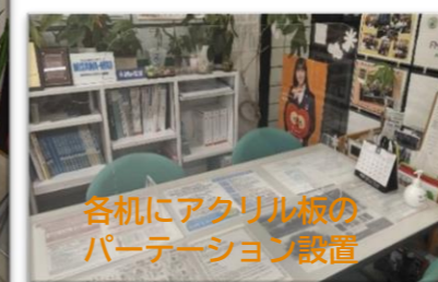
各机にアクリル板のパーテーション設置

店舗には手を消毒する機械や各テーブルにパーテーションを設置しております。使用した後の机やイスの消毒もこまめに行っております。